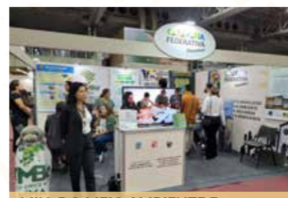
MIN. DO MEIO AMBIENTE E MUDANÇA DE CLIMA