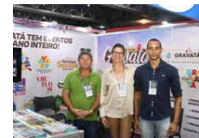
PREFEITURA - GRAVATÁ