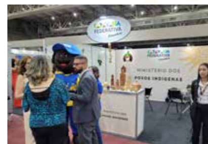
MIN. DOS POVOS INDÍGENAS