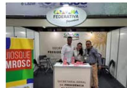
SECRETARIA GERAL DA PR