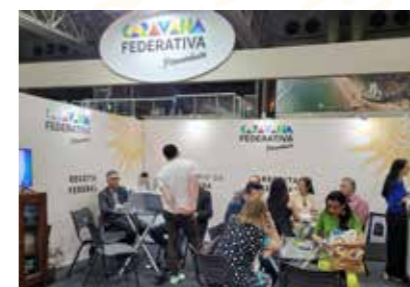
MIN. DA FAZENDA