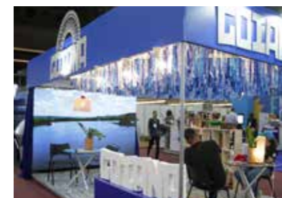
PREFEITURA - GOIANA