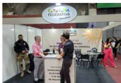
MIN. DO EMPREENDEDORISMO