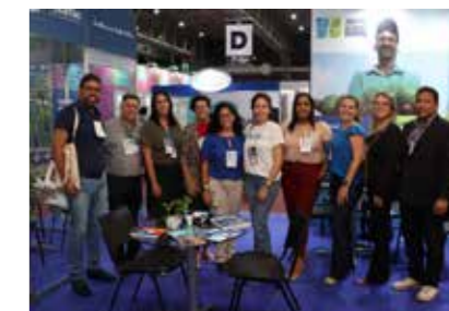
PREFEITURA - JABOATÃO