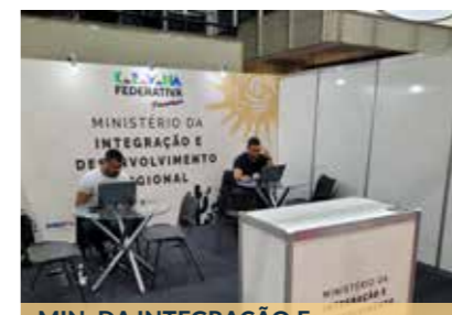
MIN. DA INTEGRAÇÃO E DESENVOLVIMENTO REGIONAL