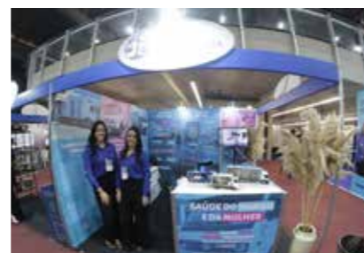
INSTITUTO DULCE DALVA