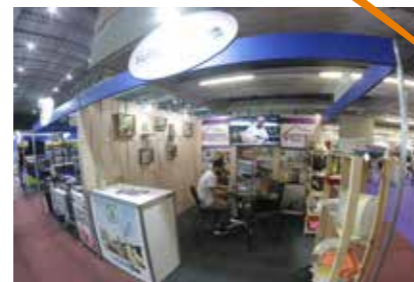
PREFEITURA - SURUBIM