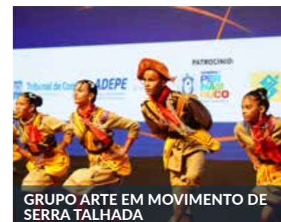
GRUPO ARTE EM MOVIMENTO DE SERRA TALHADA