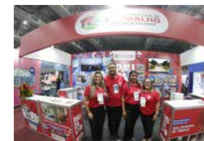
PREFEITURA - PAUDALHO