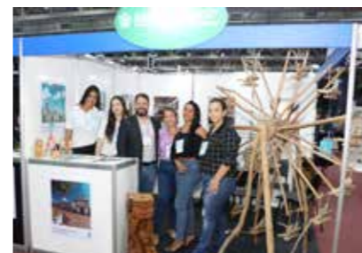
PREFEITURA - IGARASSU