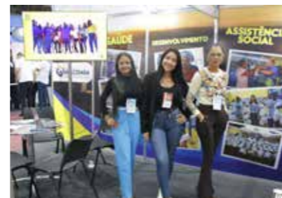
PREFEITURA - ARAÇOIBA