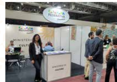
MIN. DA CULTURA