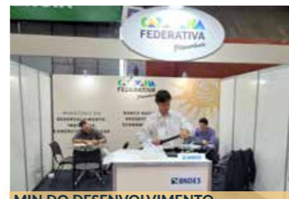
MIN. DO DESENVOLVIMENTO, INDUSTRIA E COMERCIO