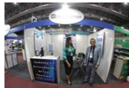
RDE CONSULTORIA E ACESSORIA