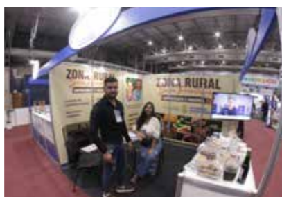
PREFEITURA - AFOGADOS DA INGAZEIRA