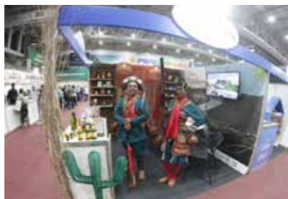
PREFEITURA - SERRA TALHADA