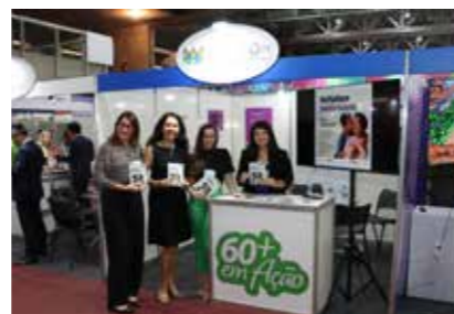
MINISTÉRIO PÚBLICO - PE