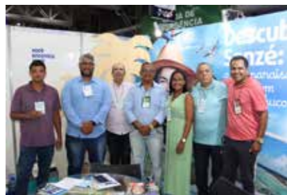
PREF. - SÃO JOSÉ DA COROA GRANDE