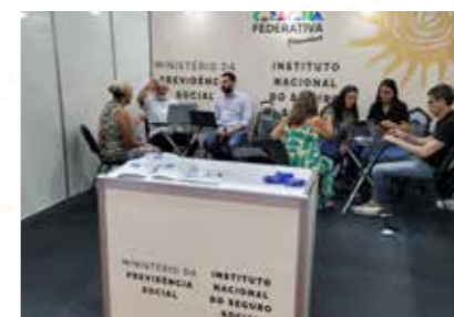
MIN. PREVIDÊNCIA SOCIAL