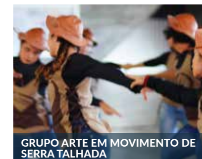
GRUPO ARTE EM MOVIMENTO DE SERRA TALHADA