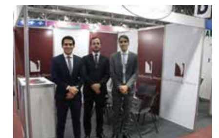
DIAS, REZENDE E ALENCAR ADVOCACIA