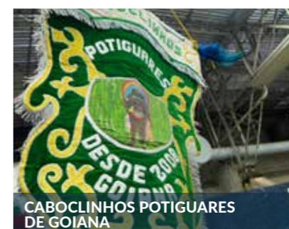
CABOCLINHOS POTIGUARES DE GOIANA