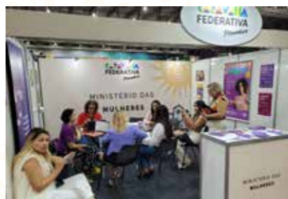
MIN. DAS MULHERES