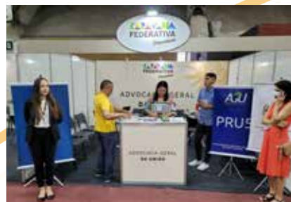
ADVOCACIA GERAL DA UNIÃO