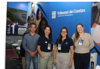
TRIBUNAL DE CONTAS