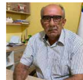
LUCIANO TORRES prefeito de Ingazeira

A gente resolveu o problema junto ao FNDE, junto a Funasa, Ministério das cidades e Ministério da Saúde. Então essa é a importância de trazer para perto dos Municípios o que tá lá em Brasília. A nível de Estado, nós também tivemos várias resoluções, ao procurarmos as secretarias que estavam presentes.