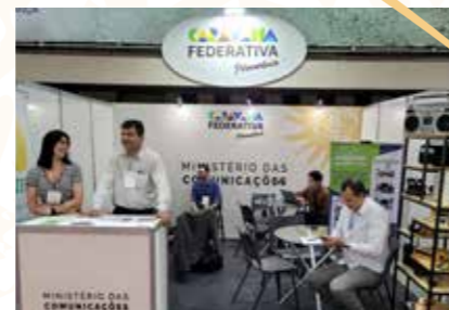
MIN. DAS COMUNICAÇÕES