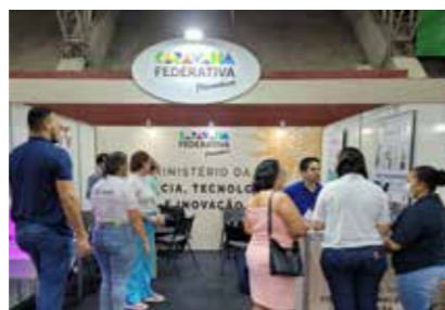
MIN. DE CIÊNCIA E TECNOLOGIA