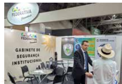
GABINETE DE SEG. INSTITUCIONAL