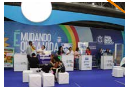
GOVERNO DE PE