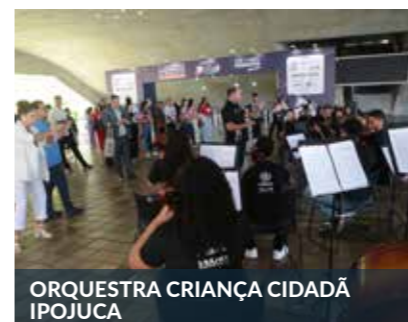
ORQUESTRA CRIANÇA CIDADÃ IPOJUCA