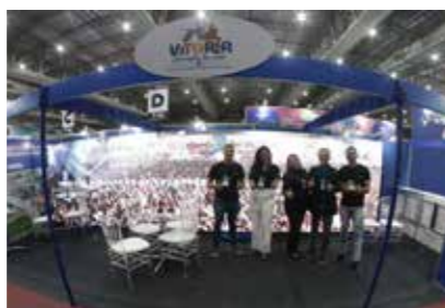
PREF. - VITÓRIADE SANTO ANTÃO