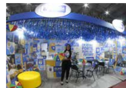
PREFEITURA - OLINDA