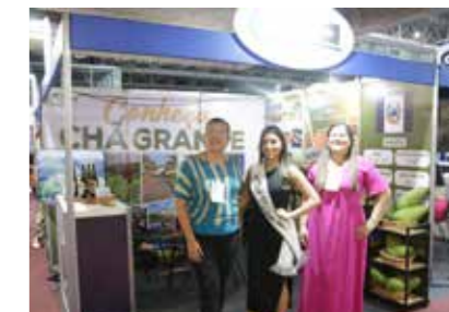
PREFEITURA - CHÃ GRANDE