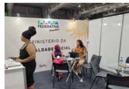
MIN. DA IGUALDADE RACIAL