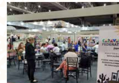
MIN. DA EDUCAÇÃO-FUNDEB