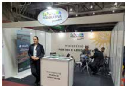
MIN. DE PORTOS E AEROPORTOS