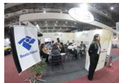
MIN. DA RECEITA FEDERAL