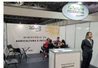
MIN. DA AGRICULTURA E PECUÁRIA