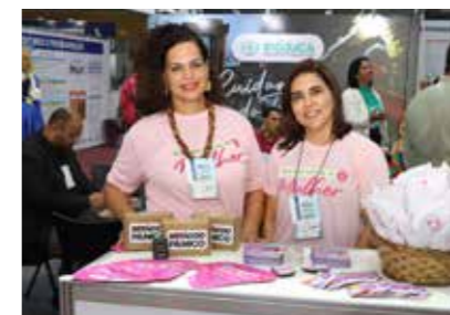
PREFEITURA - IPOJUCA