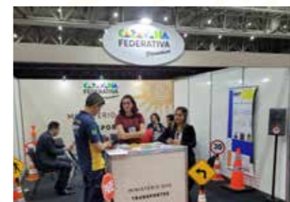
MIN. DOS TRANSPORTES