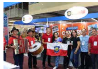
PREFEITURA - CUMARU