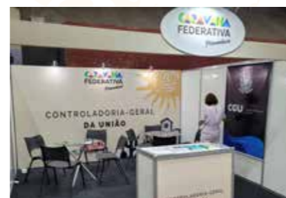
CONTROLADORIA GERAL DA UNIÃO