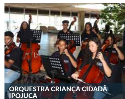
ORQUESTRA CRIANÇA CIDADÃ IPOJUCA