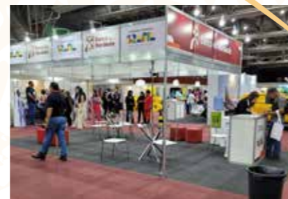
BANCO DO NORDESTE