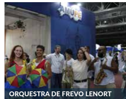
ORQUESTRA DE FREVO LENORT