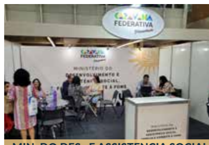
MIN. DO DES. E ASSISTENCIA SOCIAL, FAMILIA E COMBATE A FOME