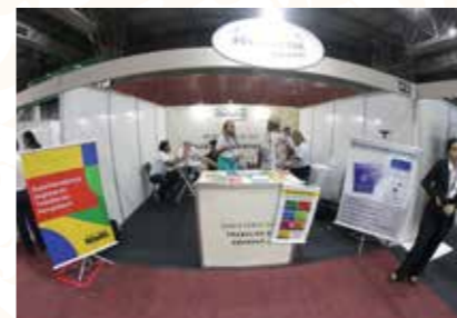
MIN. DO TRABALHO