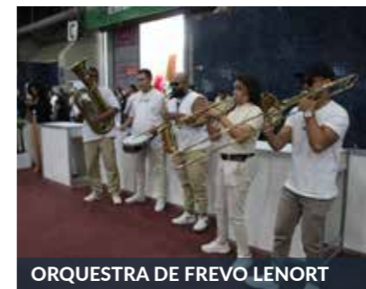
ORQUESTRA DE FREVO LENORT