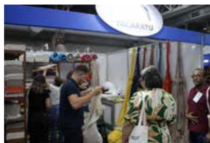
PREFEITURA - TACARATU