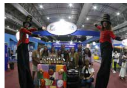
PREFEITURA - JUREMA