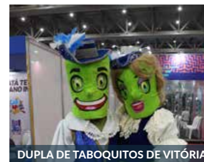
DUPLA DE TABOQUITOS DE VITÓRIA