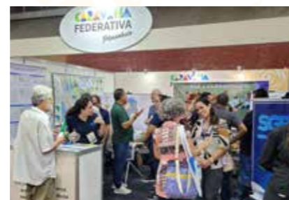
MIN. DE MINAS E ENERGIA