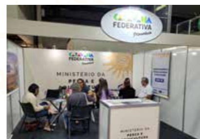
MIN. DA PESCA E AQUICULTURA