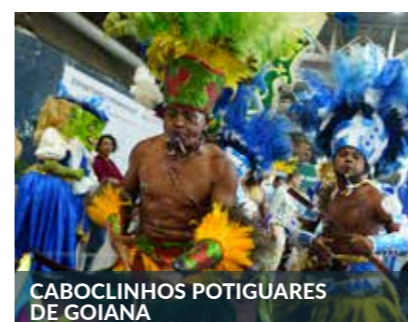
CABOCLINHOS POTIGUARES DE GOIANA