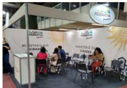
MIN. DAS CIDADES