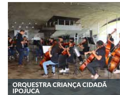
ORQUESTRA CRIANÇA CIDADÃ IPOJUCA