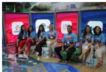
PREFEITURA - RECIFE