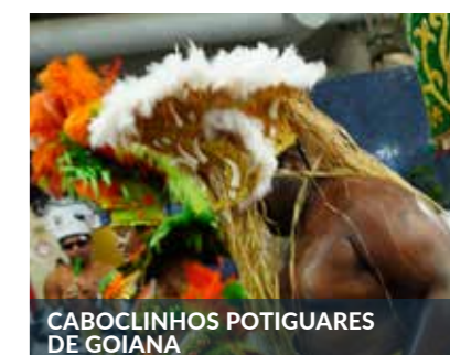
CABOCLINHOS POTIGUARES DE GOIANA