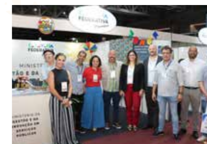
MIN. DA GESTÃO E INOVAÇÃO