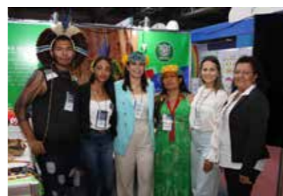
PREFEITURA - ÁGUAS BELAS