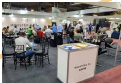
MIN. DA SAÚDE