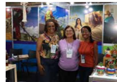
PREFEITURA - CAMARAGIBE