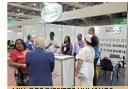
MIN. DOS DIREITOS HUMANOS E CIDADANIA