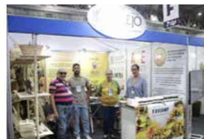
PREF. - BREJO DA MADRE DE DEUS