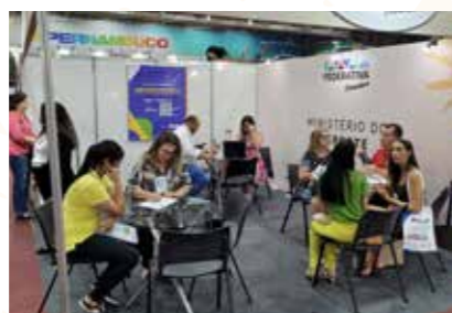
MIN. DO ESPORTE