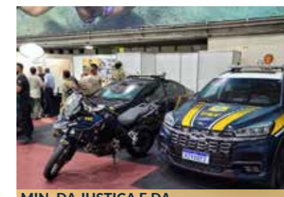
MIN. DA JUSTIÇA E DA SEGURANÇA PÚBLICA